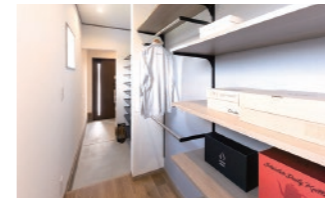
身支度、ただいま動線を実現 暮らしのシーンを考えた便利な 動線上ファミリークローゼット