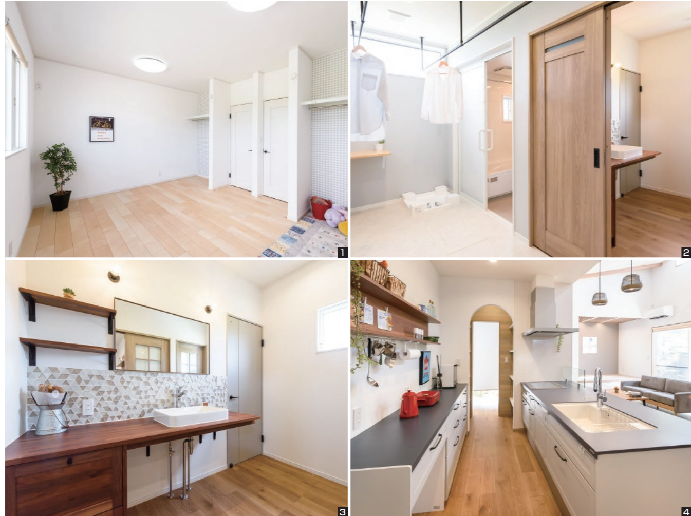
1 子どもの部屋は将来的に仕切れるように扉や窓、棚を2つつつ設けており、ライフステージの変化に柔軟に対応可能です 2 脱衣所兼ランドリールームは空間を広めに取り、洗濯物を干したり、収納を設けたりしやすくしてあります 3 無垢の木を採用した洗面台は優しく穏やかな雰囲気です。玄関からの動線上にあるので、帰宅後の手洗いが習慣づけられます 4 キッチン背面のマグネットボードラックは、見せる収納としておしゃれに使いつつ、物を取り出しやすく便利です