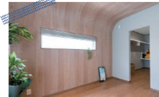
スタイリッシュな主寝室 独創的な形状の天井と壁 天然木「ピンクカバ」を採用

肌に触れたときに優しい自然素材とシンプルで美しいデザイン、 そんな北欧インテリアに日本人の感性に響く和の趣を掛け合わせた ジャパニスタイルの平屋が誕生しました。 回遊性のある動線に収納や家事空間をコンパクトに配置。 暮らしの隅々にゆとりをもたらす風の時代を先取りした モデルハウスをぜひご覧ください。