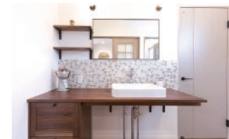
無垢材の洗面台 優しい感触に包まれる穏やかな日常 動線上で、おしゃれに便利に