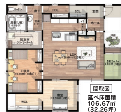
間取図 延べ床面積 106.67㎡ (32.26坪)