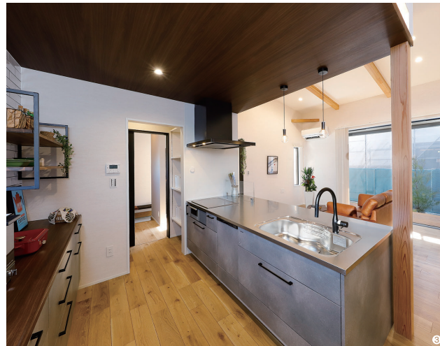
①キッチン横に位置するスキップフロア。下は蔵のように仕上げたため、遊びの部屋や収納などにも活用できる。②スキップフロアは、学習やテレワークなどマルチに使える。小さな扉の向こうは子供部屋。はしごで昇降する遊び心も。③対面で作業できるフラットなワークトップや収納力が魅力のキッチン。パントリーを挟んで玄関ホールとつながる利便性がうれしい。