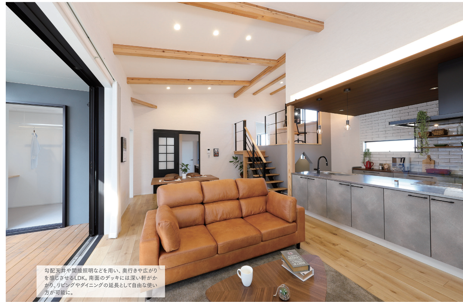
勾配天井や間接照明などを用い、奥行きや広がりを感じさせるLDK。南面のデッキには深い軒がかけられ、リビングやダイニングの延長として自由な使い方が可能に。